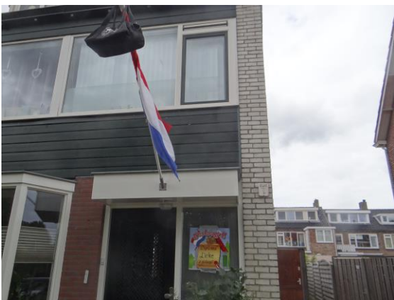
Trots dat zoon- of dochterlief geslaagd is.

De Krim staat wel bekend als een wijk waar vooral ouderen wonen, maar dat er ook tientallen scholieren wonen werd in juni duidelijk toen vlaggen uithingen, omdat een zoon of dochter een opleiding had afgerond.