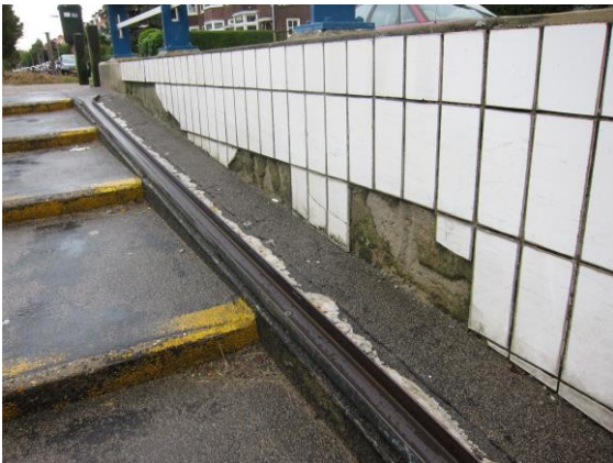
Verbetering van de tunnel is geen overbodige luxe

Algemeen kan worden gesteld dat het tunneltje een belangrijke schakel vormt met de andere kant van de Randweg. Gebruikers vinden het belangrijk dat het schoon, goed verlicht en veilig is. Dit is het uitgangspunt. In dat kader zouden spiegelende hoeken overwogen kunnen worden.