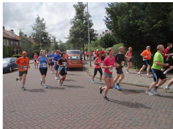
Honderden deelnemers renden door de wijk.

Hierna waren de wedstrijden van 5 en 10 km aan de beurt. Net als in voorgaande jaren namen ook nu weer bekende schrijvers deel aan de wedstrijd die gedeeltelijk door de wijk en verder door Bloemendaal liep.