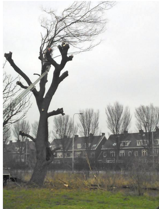
Na de snoei weer tot volle wasdom gekomen

Hier zijn standaardformules voor, die Spaarnelanden graag uitlegt als zij haar plan maakt. Spaarnelanden is dan ook tevreden dat overleg met de wijkraad plaatsvindt.