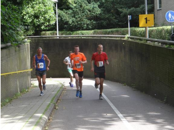
Deelnemers rennend door het Bloemendaaltunneltje.

De organisatie was ook dit jaar vlekkeloos zoals de wijkraadleden opmerkten die de Letterenloopdeelnemers aanmoedigden. Met een klein legertje aan vrijwilligers werd het traject gemarkeerd, waardoor voorkomen werd dat verkeer hinder had van lopers en omgekeerd.