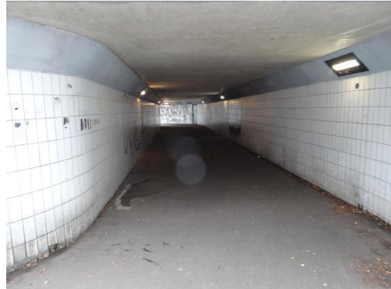
Het Stuyvesanttunneltje in november 2014

De afgelopen twee jaar heeft de wijkraad zich ingezet om het Stuyvesanttunneltje bij de provincie en de gemeente op de agenda te plaatsen. Twee jaar geleden heeft dat effect gehad in het beter plaatsen van de fietswielgeleiders aan de kanten van de toegangstreden naar de tunnel. Ook heeft de gemeente gezorgd voor verbeterde lichtbakken in het tunnelstuk. In een vervolgesprek dat 20 november plaatsvond en waar provincie, gemeente en wijkraad aan deelnamen zegde de provincie toe dat eind 2015 of begin 2016 het tunneltje een grondige opknappbeurt zal ondergaan. De inrij in het donkere tunneldeel zal verbeteren evenals de toegang voor minder valide gebruikers. Ook zullen de tegeltjes worden vervangen door een neutraalkleurige wand met een grafittibestendige coating. Het blijft echter, conform het bestemmingsplan, een voetgangerstunneltje.