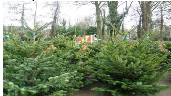
Kerstfeest op de Krim 2013