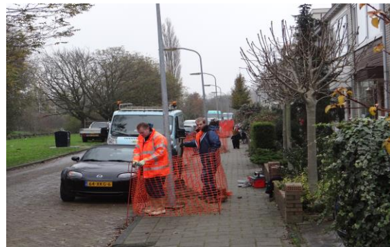
Start van de verduurzaming van lichtarmaturen

Begin november kregen de bewoners van de wijk een bericht van Ziut BV dat dit bedrijf voor de kerst de bestaande verlichting zal veranderen door led-verlichting. De gemeente, die duurzaamheid hoog in haar vaandel draagt, vernieuwt hiermee niet alleen het verouderde straatverlichtingssysteem, het zorgt er ook voor dat de energiekosten tot ongeveer met de helft worden gereduceerd en onderhoudskosten in de nabije toekomst substantieel zullen worden verminderd. Het is de hoop van de wijkraad dat deze duurzaamheidsactie tot gevolg zal hebben dat gemeentelijke belastingen in de nabije toekomst minder snel zullen stijgen.