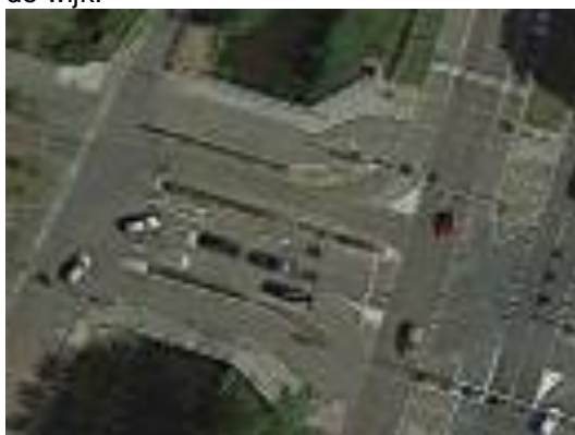
Verkeerssituatie bij de Orionbrug

In de vorige nieuwsbrief hebben we melding gemaakt over de problematiek rond het enkele jaren geleden gewijzigde kruispunt bij de Orionbrug. Als fietser rijd je daar permanent met de handen aan de remmen omdat er zich regelmatig onduidelijke situaties voordoen. Naar aanleiding van de jaarvergadering en daaropvolgende gesprekken met de gemeente heeft de wijkraad toestemming gekregen om een onafhankelijke partij in te huren die een verslag van bevinding van de situatie zal maken en conclusies en aanbevelingen definiëren die we vervolgens met de gemeente gaan bespreken. De wijkraad verwacht dat de studie in oktober wordt uitgevoerd zodat we u in de volgende nieuwsbrief kunnen informeren over de bevindingen. Als wijkraad voelen we ons een gewaardeerde partij in dit proces, dat moet leiden tot verhoogde verkeersveiligheid in de wijk.