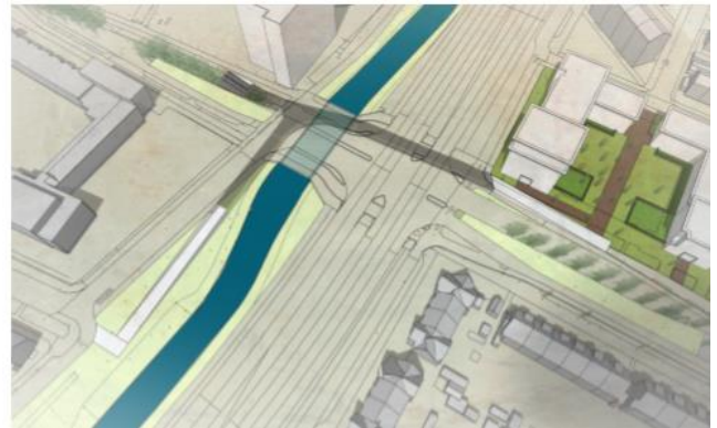
Een onmogelijke fietstunnel compleet met T-splitsing