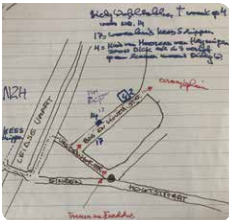
Situatieschets van de route van de gaarkeuken in de NZH remise naar de Bosch en Hovenstraat