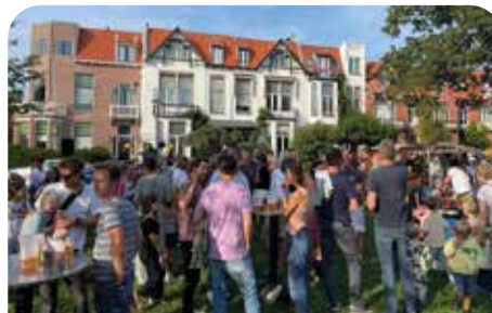
'Hey, lang niet gezien! Waar zijn jullie geweest? Leuk, leuk. Nu maandag weer naar school hè? Ja ja, het echte leven gaat weer beginnen.' (Dit gesprek kwam de redactie zo'n 100+ keer ter ore deze middag)