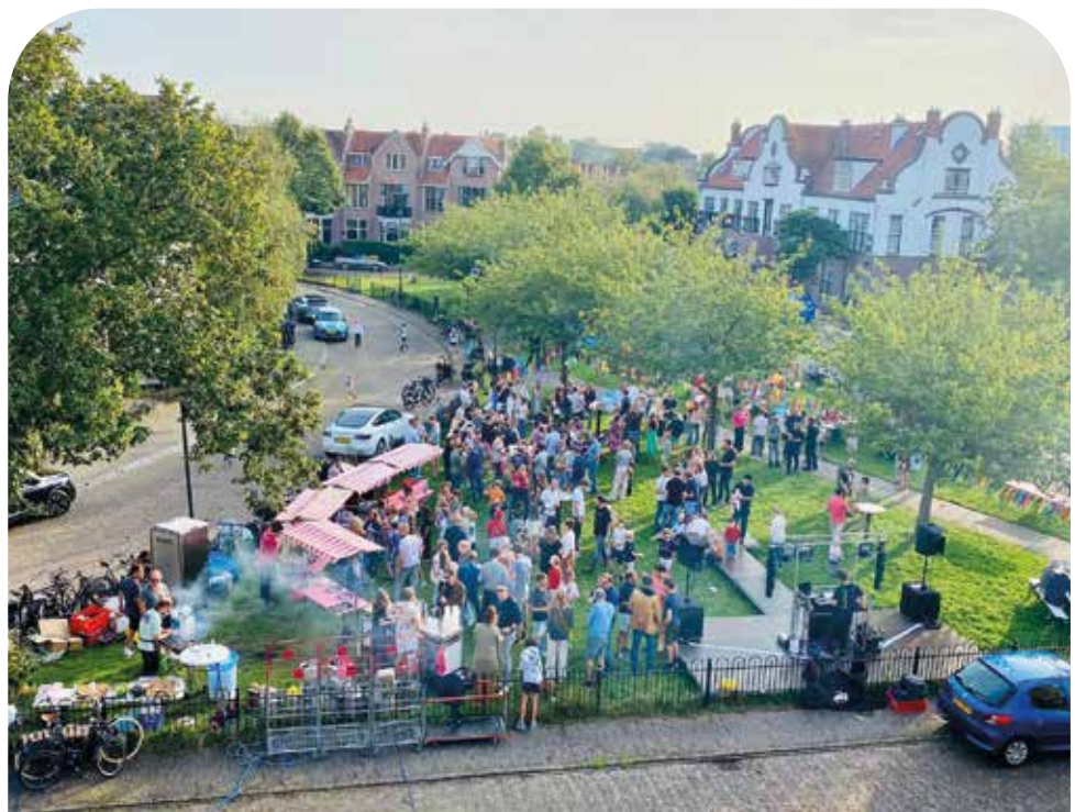
Jong en oud begeeft zich richting het inmiddels bekende evenementenplein van de buurt; het Oranjeplein.