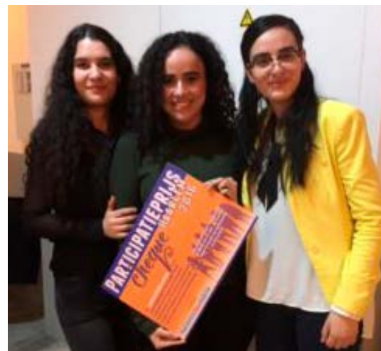
De winnaars van de Participatieprijs

Participatieprijs is een aanmoediging voor Haarlemse initiatieven die bijdragen aan een stad waarmee meer aandacht voor elkaar is en waar elke Haarlemmer mee kan doen. De prijs bestaat uit een geldbedrag van € 1500,- dat besteed wordt aan de uitvoering van het winnende initiatief.